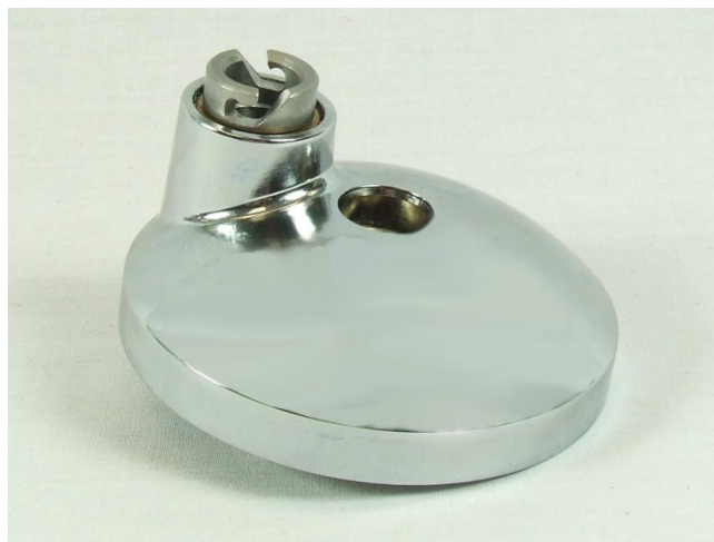
Planetario nuovo KW715265