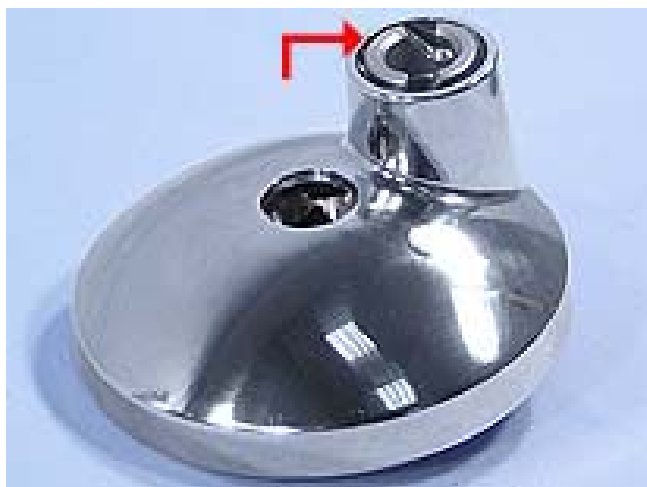
Planetario premodifica KW710252