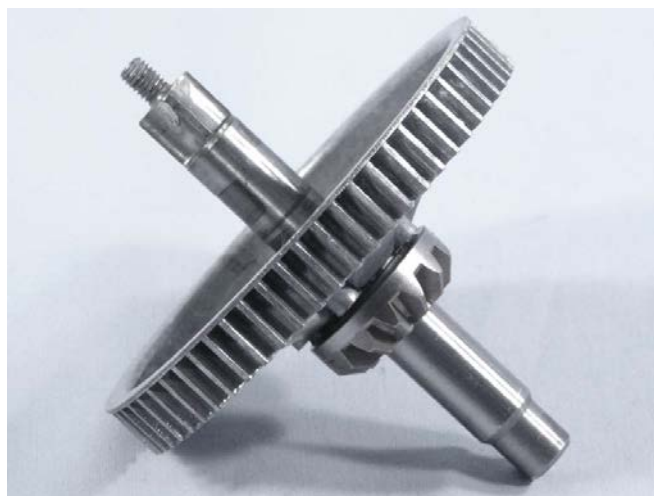
Albero premodifica KW710368