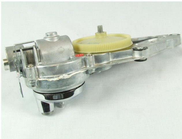
Assieme scatola nuova KW715260