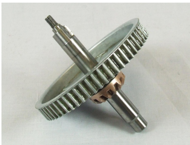
Albero nuovo KW715267