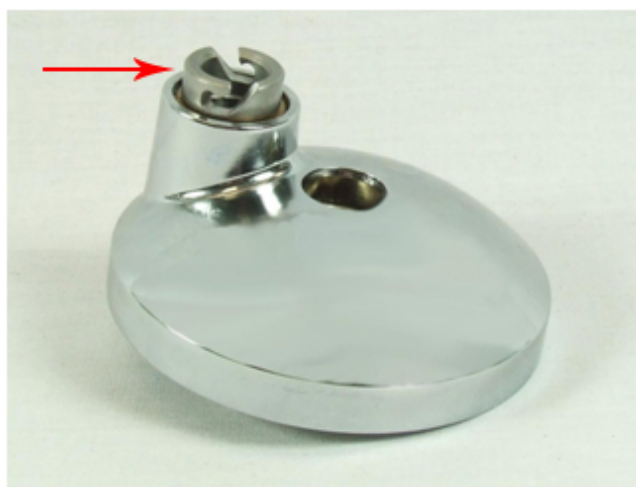
Planetario post modifica

ATTENZIONE: il nuovo planetario NON E' INTERCAMBIABILE con quello delle versioni precedenti.