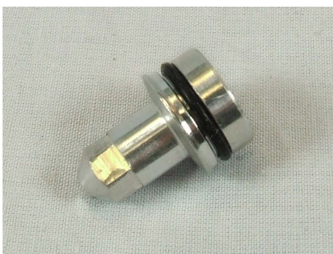
Dado nuovo KW715270

ATTENZIONE: I codici premodifica KW710372 Assieme scatola premodifica KW710252 Planetario premodifica KW710368 Albero premodifica KW674576 Dado premodifica nonché il kit SER1019 che comprende gli ultimi tre , saranno disponibili fino ad esaurimento scorte.